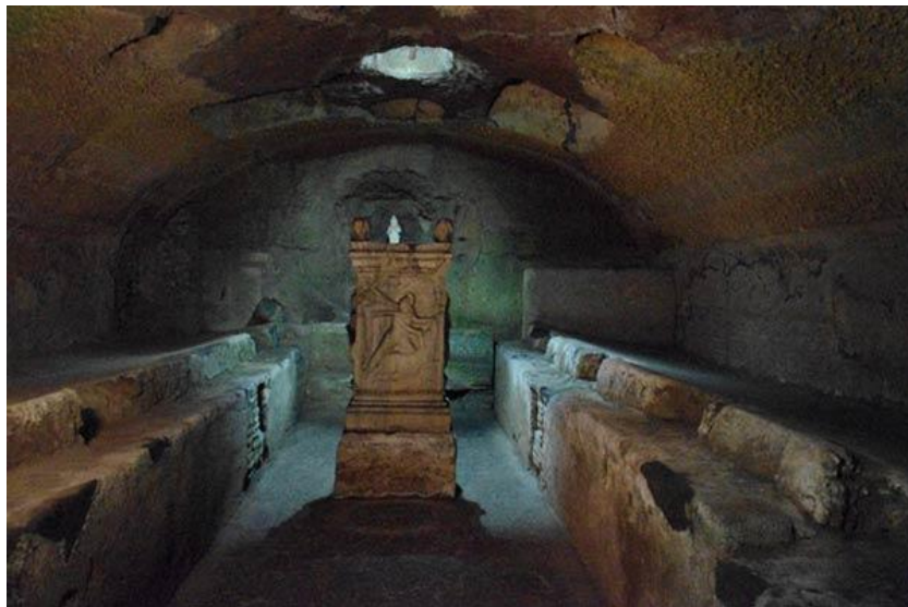
Los Misterios de Mitra y la Cámara subterránea de San Clemente

El espíritu fraternal y democrático de las primeras comunidades y su origen humilde; la identificación del objeto de adoración con la luz y el sol: las leyendas de los pastores con sus dones y la adoración. el diluvio y el arca; la representación artística del carro de fuego y la extracción de agua de las piedras; el uso de campanas y velas, agua bendita y la comunión; la santificación del domingo y del 25 de diciembre; la insistencia en la conducta moral, el énfasis que ponían en la abstinencia y el autocontrol: la doctrina del cielo y el infierno, de la revelación primitiva. de la mediación del Logos que emana ele lo divino. el sacrificio expiatorio. la lucha constante entre el bien y el mal y el triunfo final de aquel. la inmoralidad del alma. el juicio final. la resurrección de la carne y la destrucción del universo por el fuego son algunas de las similitudes que. reales o tan solo aparentes. permitieron al mitraísmo prolongar su resistencia al cristianismo.