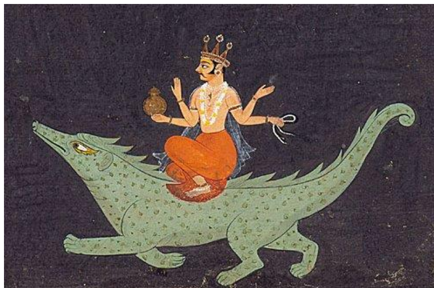
Mitra pertenece a la mitología persa, india y romana

John O'Neill cuestiona la teoría de que Mitra fuese una divinidad solar y, en The Night of the Gods , escribe lo siguiente: «El Mitra avestano, el yazata de la luz, tiene “diez mil ojos, es alto, con pleno conocimiento ( perethuvaedyana ), es fuerte, no duerme y está siempre en vela ( jaghaurvaunghem )”. El dios supremo Ahura Mazda también tiene un solo ojo o, de lo contrario, se dice que “con sus ojos, el sol, la luna y las estrellas, todo lo ve”. La teoría de que Mitra era originariamente un título del dios supremo de los cielos (que expulsaba de la corte al sol) es la única que cumple todos los requisitos. Resulta evidente que aquí tenemos orígenes en abundancia para el ojo de la masonería y su nunquam dormio .» El lector no debe confundir el Mitra persa con el védico. Según Alexander Wilder, «los ritos mitraicos sustituyeron a los Misterios de Baco y se convirtieron en la base del sistema gnóstico, que se impuso durante muchos siglos en Asia, Egipto e incluso en el Occidente remoto».