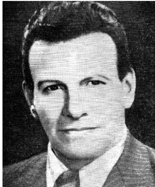
Samael Aun Weor

“El hombre está tan cerca de Dios, que de por medio solo está la Mente”