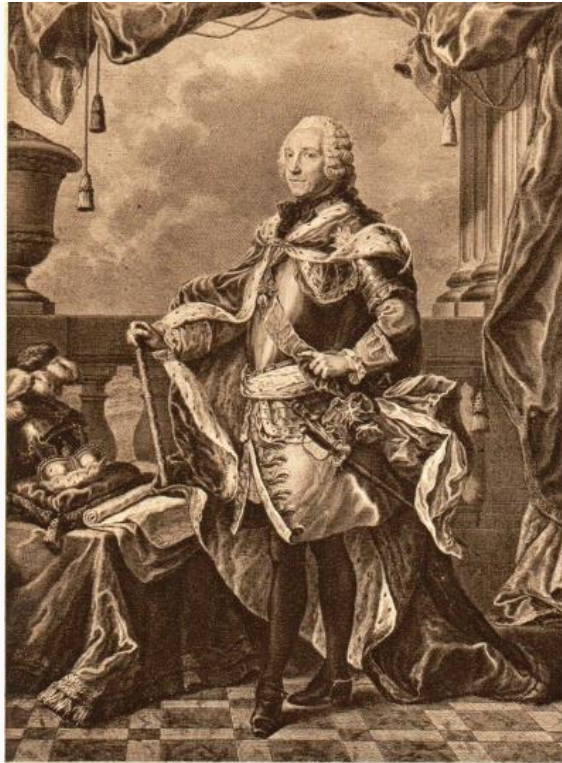
Marqués de Belle-Isle

Algunos de estos caballeros que acompañaban al mariscal, se apresuraron a conformar una logia en Francfort en la que fueron iniciados numerosos aristócratas alemanes. Uno de ellos, el barón Carl-Gotthelf von Hund, señor de Altengrotkau y de Lipse, llevaría a cabo el plan de los jacobitas y constituiría el movimiento masónico-templario de más vasto alcance en la historia moderna.