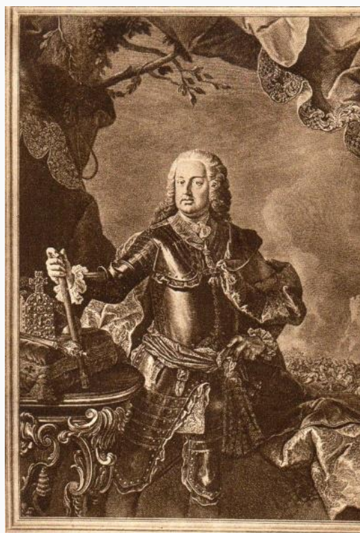
Francisco Esteban, Duque de Lorena

Hijo de Leopoldo, duque de Lorena, -y nieto de Carlos de Lorena que, como hemos visto, había combatido a los turcos en las filas de Sobiesky- Francisco Esteban había nacido en Nancy en 1708 y heredado el ducado en 1729. En los años siguientes a su iniciación se vio envuelto en la guerra de Sucesión Polaca como consecuencia de su casamiento con María Teresa Habsburgo. En compensación por la cesión de Lorena a Leszczyński recibió el Gran Ducado de Toscana, cuya soberanía había quedado vacante en 1737 con la extinción de la dinastía de los Médici.