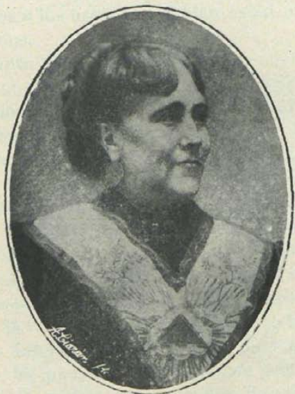
IL. H.ª. MARIA DERAISMES Fundadora de «El Derecho Humano»