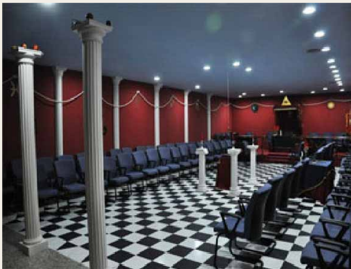
Una perspectiva del templo del GOLA en España

Centésimo trigésimo primera edición de la revista