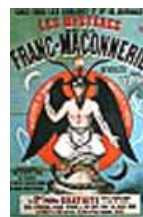
Cubierta de uno de los fascículos del «Canular de Taxil».

De otro lado, algunos autores católicos del siglo XIX han igualmente condenado el conjunto de la francmasonería debido a prácticas teúrgicas que consideran representativas. Es en este mismo contexto que ha aparecido el célebre Canular de Taxil .