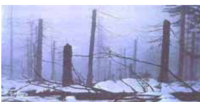
La lluvia ácida extermina los bosques.... así los vemos.