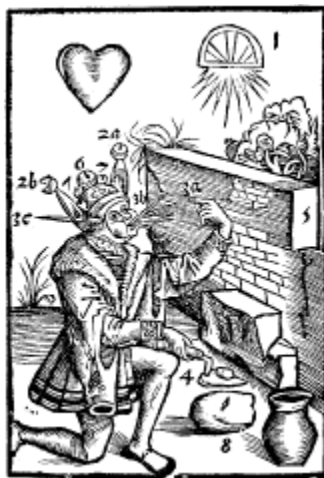
Carta de la memoria de Thomás Murner, 1509.

Esta hipótesis encuentra un principio de prueba en el hecho de que, precisamente, existen unos juegos de cartas que explícitamente son unos juegos de Arte de la memoria y cuyos ciertos detalles iconográficos distintamente evocan el espíritu de los arcanos mayores del naipe. Así, en 1509, Thomás Murner publica en Estrasburgo un tratado titulado Logica memorativa , que se funda totalmente sobre un juego de cartas. Ya, hacia 1465, el juego italiano falsamente atribuido a "Mantegna", constituido por 50 cartas exclusivamente "mayores", cuya gran parte es perfectamente análoga a los arcanos del naipe, puede estar arreglado sin duda en la categoría de los juegos educativos fundados sobre la tradición clásica y erudita del Arte de la memoria.