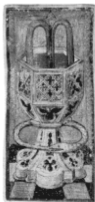
Ten de Copa del juego de la colección Goldschmidt.

A merced de las guerras de Italia y de los cambios artísticos e intelectuales, el naípe se difundirá en Francia al principio del XVI, donde conocerá, ya, una gran moda como juego. La referencia más antigua y francesa al "tarau" figura en el Gargantua (1534) de Rabelais, a título de los juegos practicados por el