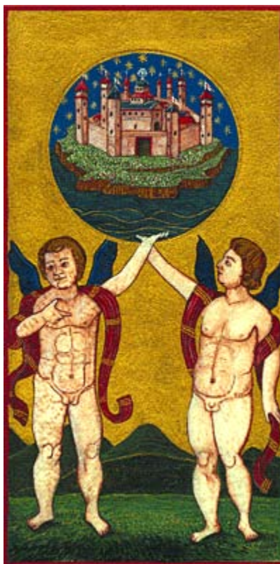
El Arcano XXI (El mundo) del juego dicho sobre "Visconti-Sforza". Miniatura sobre pergamino según el juego original, por Juan-Miguel Mathonière.