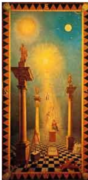
Figure 19. First Degree, Emulation Ritual.

Pero para los que ya casi hemos comprendido la realidad Científica que encierran las enseñanzas Masónicas, nos es muy fácil distinguir lo que es un LEGADO de conocimientos Morales, de Honor, de virtudes y de SABIDURÍA PROFESIONAL; dentro de los Principios inmutables que nos impone el Sagrado Deber de ENSEÑAR AL QUE NO SABE; de dar de BEBER AL SEDIENTO, y de proporcionar la COMIDA al que hambriento suele llamar a nuestras puertas; puesto que ese sólo hecho, los hombres quedarán asegurados para vivir siempre en el corazón de quienes tuvieron la satisfacción de recibir sus beneficios; por lo mismo, el Masón siempre será ÚTIL, siempre será GRANDE y siempre será INMORTAL; cuando por su dedicación al Estudio, cuando por energía desplegada en el TRABAJO, y cuando por la Nobleza de su Alma, logre hacer la felicidad de todo el Género Humano.