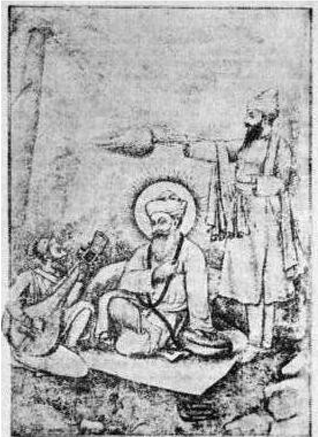
GURU NANAK, FUNDADOR DEL SIHKISMO.