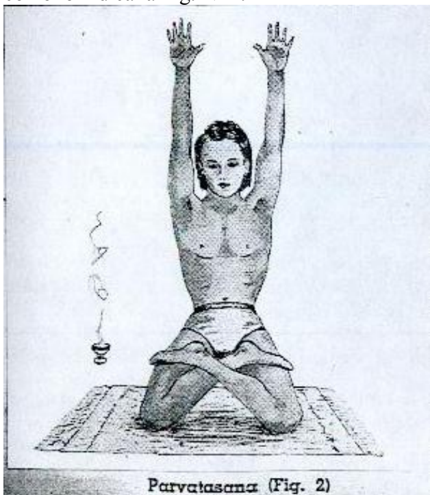
Parvatasana (Fig. 2)

Hacer la PADMASANA, luego levantarse sobre las rodillas y elevar las manos como lo indica la Fig. N° 2.